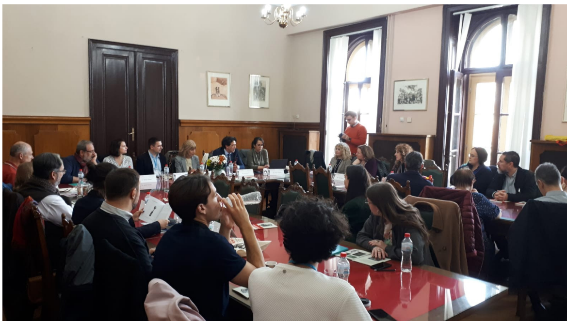
Slika 3. Prvi dan konferencije

Potom je Anita Paoliki objasnila političke i istorijske činioce koji su doprineli prihvatanju ikonografskog rešenja apokaliptične sadržine luteranske Biblije na koricama pravoslavnog jevanđelja nastalog ktitorijom vlaškog vojvode. Najzad, u okviru zajedničkog izlaganja, Profesor Janis Varalis i Konstantin Dolmas, upoznali su učesnike sa preliminarnim rezultatima opsežnog istraživanja okova jevanđelja nastalih u radionici sela Recani u Tesaliji, koje odlikuju brojne ikonografske i stilske posebnosti, ukazujući na materijale i tehnološke aspekte izrade ove vredne grupe predmeta.