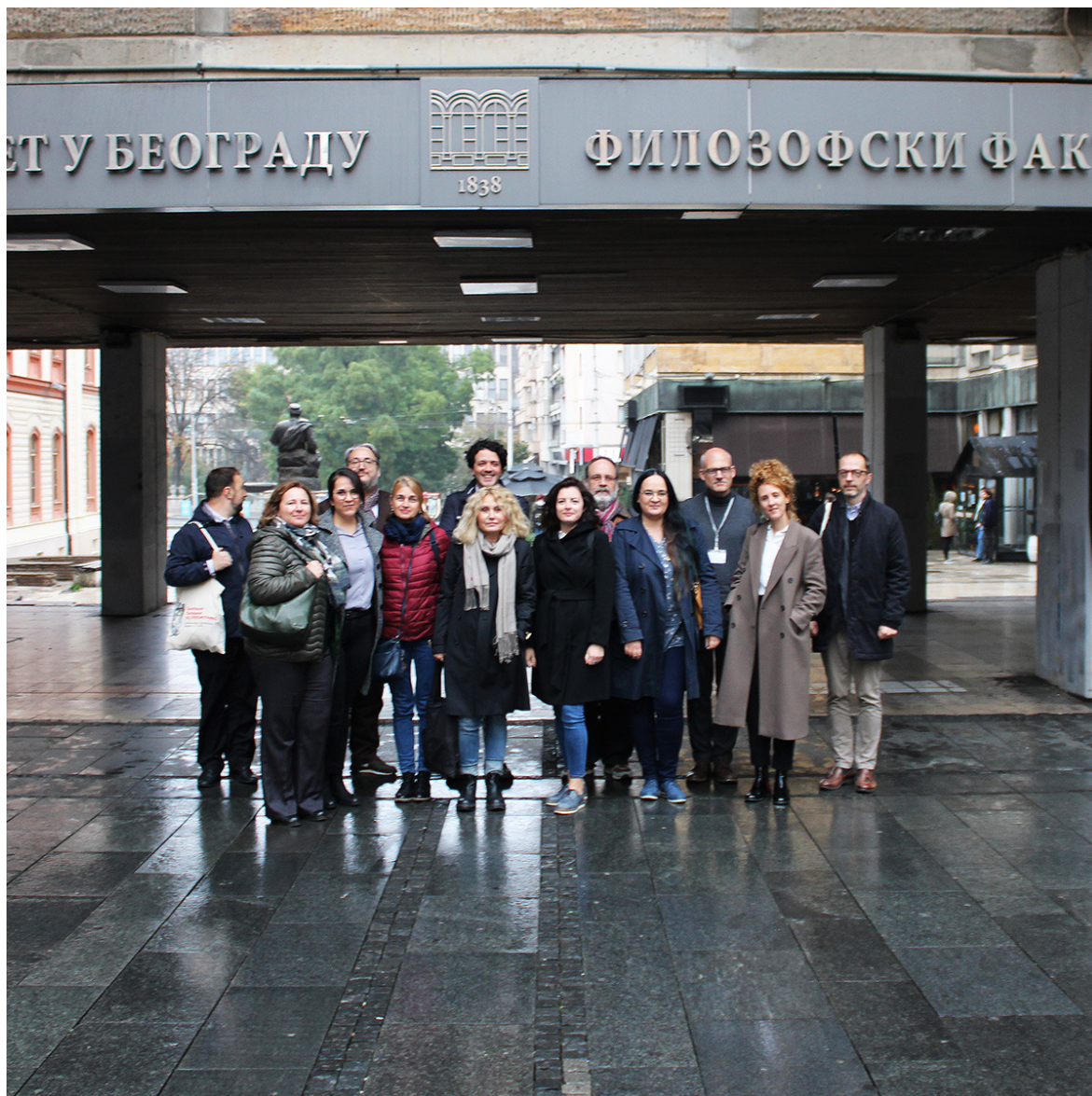
Slika 4. Učesnici konferencije