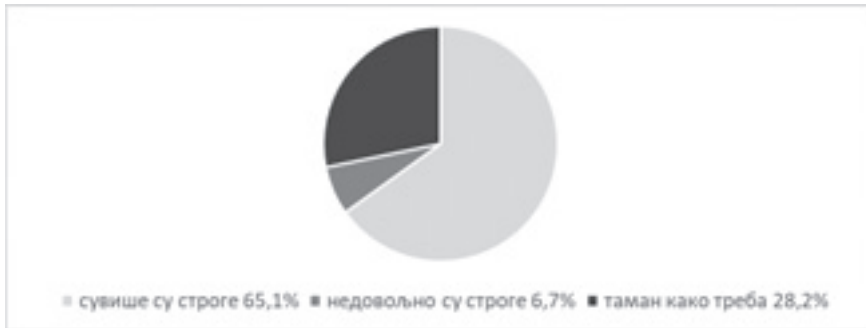
Графикон 1. Оцене мера Владе Републике Србије

На основу тога лако се може закључити да су повратници посматрани једино као претња, а да није било претеране бриге о њиховој реалној здравственој ситуацији и спремности за пружање подршке ако болест заиста наступи. Услед тога, не изненађује податак из истраживања да 65,1% испитаника, што можемо видети на Графикону 1, сматра да су уведене мере биле сувише строге. Ипак, због озбиљности ситуације њих 28,2% је подржало мере, чак је било и оних екстремнијих који су сматрали да је, по угледу на неке друге европске земље, требало увести још рестриктивније мере – укупно 6,7% испитаника.